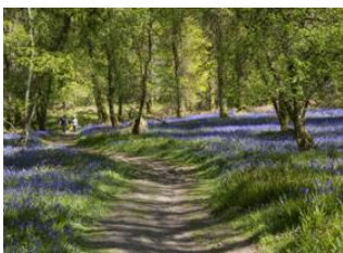
Île de Mull