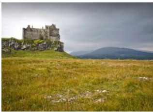
Île de Mull